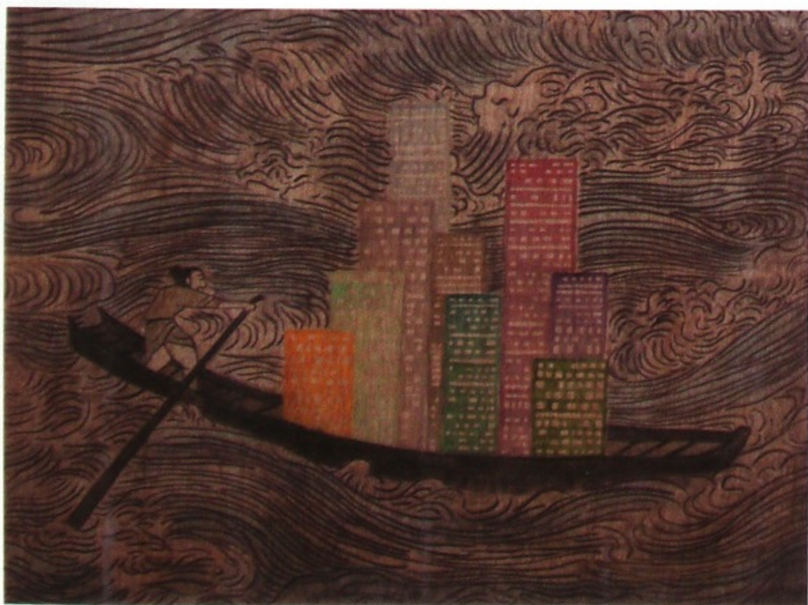
大山圖 墨水、碳、鉛筆及圖像轉印至夾板 300 x 500厘米 2011