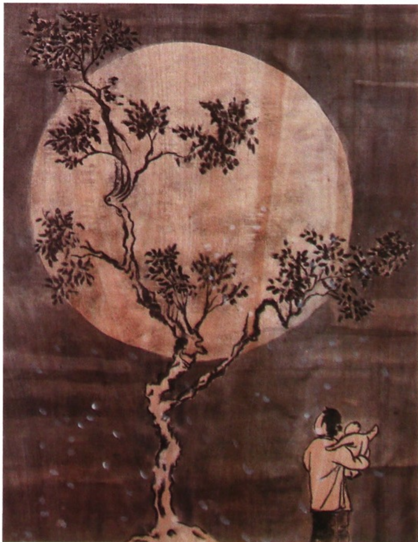
微型世界 No.3 碳與塑膠彩夾板 122 x 91厘米 2011